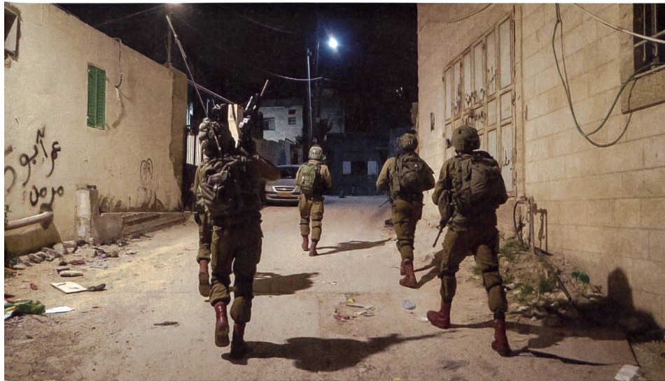
Israelische Milizsoldaten auf Patrouille: Seit Jahrzehnten gilt im Nahost-Konflikt: Falls es in einem Augenblick etwas ruhiger ist, ist dies ziemlich wahrscheinlich die «Ruhe vor dem nächsten Sturm».

rael perfektioniert. In den israelischen Streitkräften wird von der «Metro» bzw. der «U-Bahn» Gazas gesprochen. Diese Tunnel verlaufen sowohl innerhalb des Gazastreifens als auch unter der Grenze zu Ägypten.