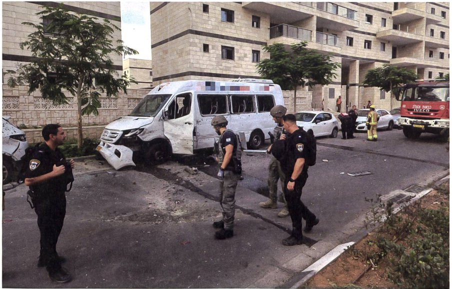
Im Mai 2021 beschloss die Hamas, zum ersten Mal seit 2014, grossflächig israelische Gebiete mit Raketen. Hier im Bild: Einschlagskrater einer Rakete.

Die Palästinenser beanspruchen diese Gebiete für einen unabhängigen Staat Palästina mit dem arabisch geprägten Ostteil Jerusalems als Hauptstadt. Im «Jom-Kippur-Krieg» 1973 versuchten Ägypten und Syrien verlorenes Territorium zurückzuerobern, der Angriff wurde von Israel erfolgreich, jedoch unter grossen Verlusten, auf den Golanhöhen abgewehrt. →