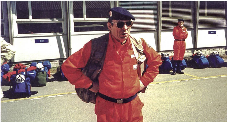
1999 am Flughafen Zürich zu Beginn einer Rettungsaktion im Rahmen der humanitären Hilfe.