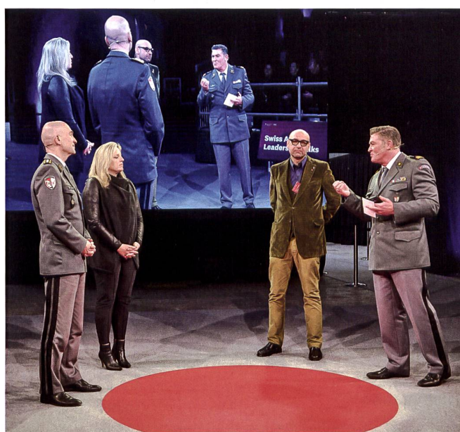
Im Anschluss an die Vorträge hatte das Publikum die Möglichkeit, Fragen zu stellen.