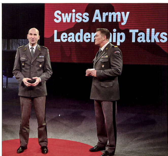
Der Chef der Armee war der Gastgeber der Leadership-Konferenz auf dem Waffenplatz Thun.