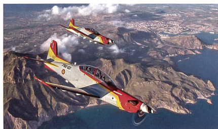
Zusätzliche PC-21 für die Spanien.

Die spanische Luftwaffe kauft weitere 16 PC-21 und dazugehörige Simulatoren und wird damit zum grössten PC-21 Betreiber in Europa. Anfangs 2020 haben sich die spanischen Luftstreitkräfte, die Ejército del Aire, entschieden, 24 PC-21 zu kaufen. Der letzte PC-21 dieses Auftrags wurde Mitte 2022 an Spanien ausgeliefert.