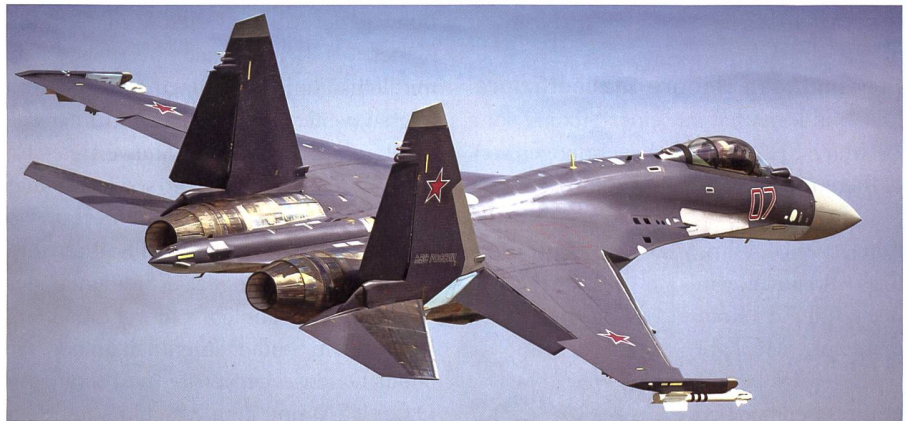
Kampfflugzeug Su-35 für den Iran.

Irans Luftstreitkräfte sind hoffnungslos veraltet, so ist es nicht verwunderlich, dass sich der Iran für modernste russische Kampfflugzeuge interessiert. Laut der iranischen Nachrichtenagentur IRNA hat sich Russland bereit erklärt, modernste Sukhoi Su-35 an den Iran zu liefern. In Fachkreisen spricht man von bis zu 50 Sukhoi Su-35, die Russland in Zukunft an den Iran liefern könnte. Wann die ersten vierundzwanzig Su-35 in den Iran geliefert werden, ist noch unklar. Der Iran verfügt neben russischen und wenig chinesischen Kampfflugzeugen derzeit auch noch über viele US-amerikanische Kampffjets, die vor der Islamischen Revolution von 1979 an den Iran ausgehändigt wurden. Darunter befinden sich noch 63 McDonnell Douglas F-4 Phantom aller Versionen, 35 Northrop 5-E Tiger II und 41 Grumman F-14