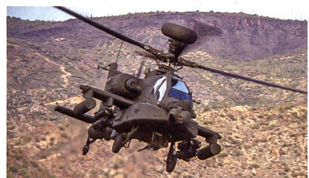
Grossauftrag für Boeing zur Herstellung von AH-64E Apaches.