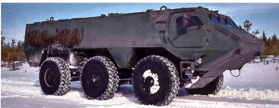
Finnland beschafft Radschützenpanzer der CAVS-Familie.