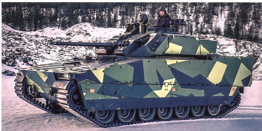
CV90 MkIV für die tschechischen Streitkräfte.

Die Tschechische Republik hat die Verhandlungen mit der schwedischen Regierung, der schwedischen Verteidigungsbeschaffungsorganisation FMV und BAE Systems Hägglunds über den Kauf von 246 Schützenpanzern CV90 MkIV in sieben verschiedenen Varianten erfolgreich abge-