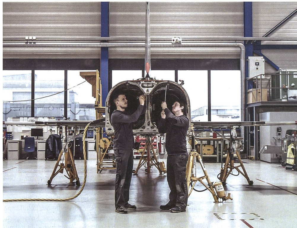
RUAG gehört zu den erfolgreichsten Ausbildungsbetrieben der Schweiz.

Gleichzeitig muss RUAG die hohe Verfügbarkeit der F/A-18-Flotte bis zur Ausmusterung aufrechterhalten. In Anbetracht des akuten Fachkräftemangels und der eingeschränkten Materialverfügbarkeit sind dies auch in den kommenden Jahren herausfordernde Aufgaben. +