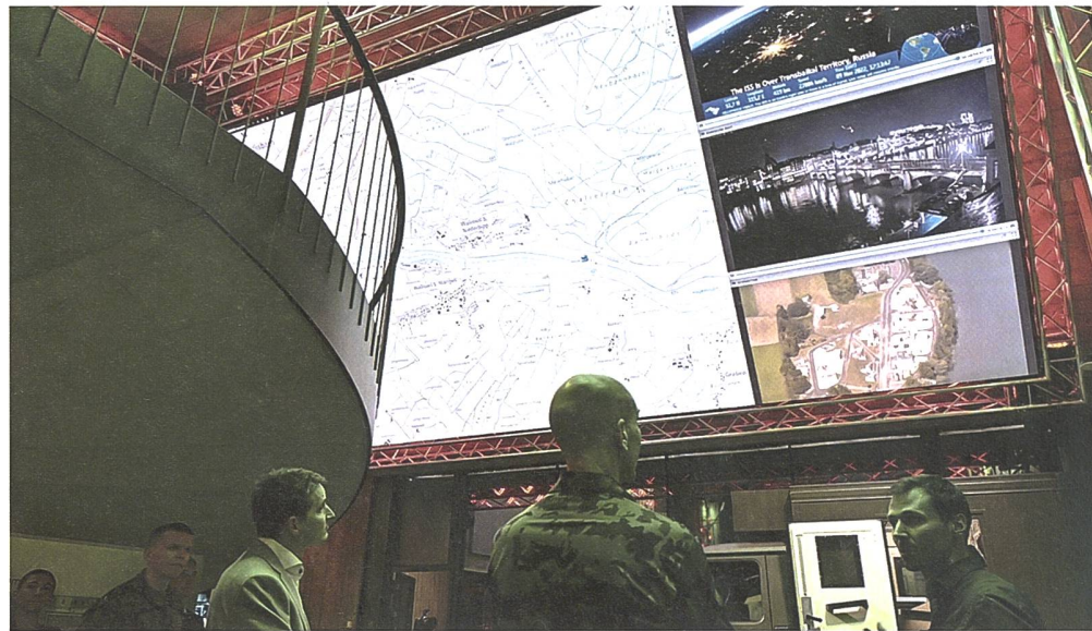
Um die stetig zunehmende Komplexität der IT-Digitalisierung im Sicherheitsumfeld zu berücksichtigen, hat RUAG das Programm C5I gestartet.

Wie im Geschäftsjahr 2022 werden zukunftsgerichtete Investitionen sowie die Bereinigung von Altlasten, insbesondere in Zusammenhang mit der IT-Infrastruktur