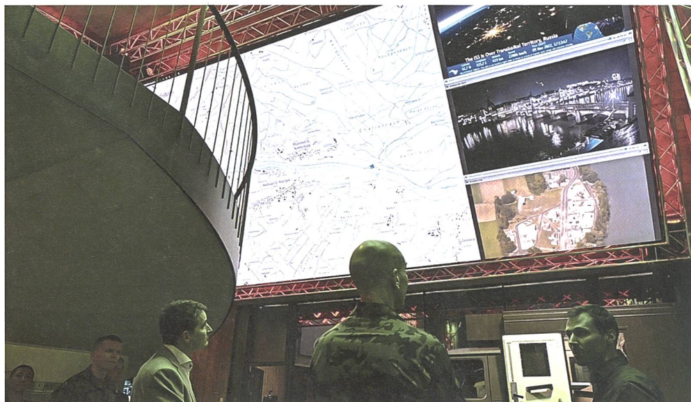
Um die stetig zunehmende Komplexität der IT-Digitalisierung im Sicherheitsumfeld zu berücksichtigen, hat RUAG das Programm C5I gestartet.

Wie im Geschäftsjahr 2022 werden zukunftsgerichtete Investitionen sowie die Bereinigung von Altlasten, insbesondere in Zusammenhang mit der IT-Infrastruktur