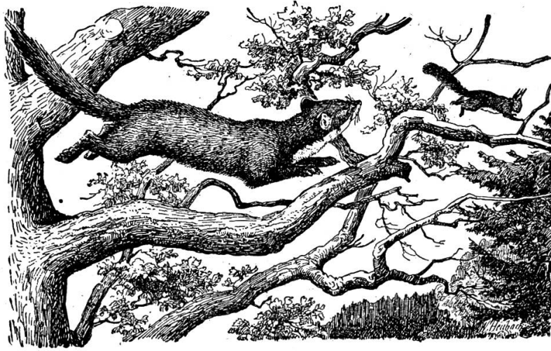
Baum- oder Edelmarder.

Der Baum- oder Edelmarder bewohnt vorwiegend die Bäume des Waldes. Sein Kleid, das ein sehr wertvolles Pelzwerk liefert, ist bis auf einen gelben Kehlfleck unscheinbar braun gefärbt. Der langgestreckte, sehr biegsame Rumpf endet in einen langen, buschigen Schwanz. Die Hinterbeine zeichnen sich vor den kurzen Vorderbeinen durch