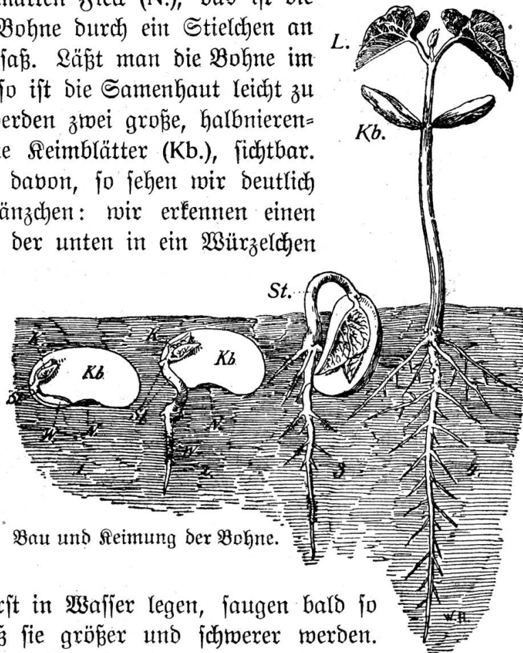
Bau und Keimung der Bohne.

diesem Zwecke zuerst in Wasser legen, saugen bald so viel davon ein, daß sie größer und schwerer werden. Nach einigen Tagen wird die Samenhaut gesprengt, und das Würzelchen kommt zum Vorschein. Bringen wir die Bohnen jetzt in lockere Erde, so dringt die Wurzel abwärts in den Boden und sendet bald nach allen Seiten Nebenwurzeln aus. Der Stengelteil unter den Keimblättern wächst stark in die Länge, krümmt sich hakenförmig, durchbricht den Boden und zieht schließlich die Keimblätter samt der Knospe aus der Erde hervor. Die Keimblätter tun sich jetzt auseinander; die ersten Laubblätter entfalten sich, und alle oberirdischen Teile ergrünen. Während die Pflanze kräftig weiter wächst, verschrumpfen die Keimblätter und fallen endlich ab.