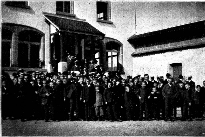
Die gegenwärtigen Zöglinge der Anstalt.

Du mußttest zwar ins alte Haus Einst deinen Einzug halten, Im alten Schloß geh'n ein und aus Und alles treu verwalten.