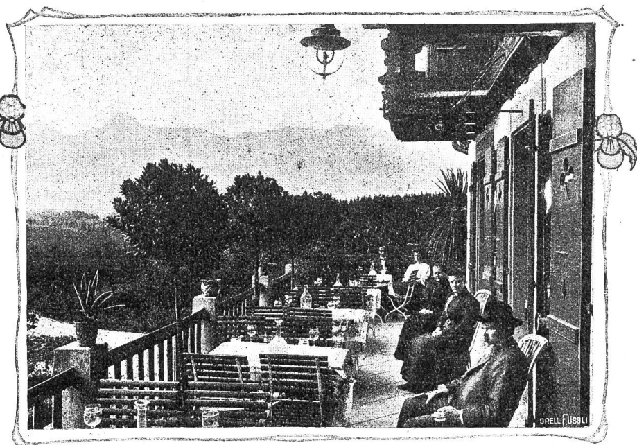
Taubstummenheim Metendorf: Terrasse.