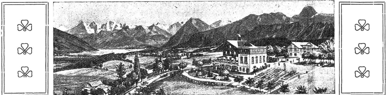
Taubstummenheim Uetendorf: Gesamtansicht.