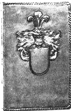
Brieftasche mit Heraldik