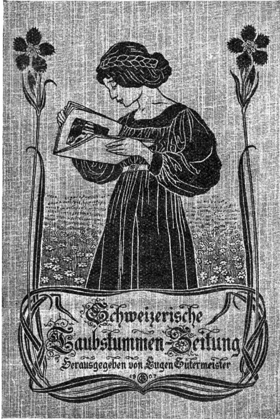
Einbanddecke 1907 entworfen von dem gehörlosen Lithographen G. Bechtel in Basel.

Dieses Blatt erschien als Beilage zu den württembergischen Blättern für Taubstumme erstmals im Januar 1874. Es enthielt zumeist Nachrichten aus den schweizerischen Taubstummenvereinen. In demselben Jahre gründeten die schweizerischen Taubstummen einen schweizerischen Taubstummenverein und beschloffen die Herausgabe einer selbständigen schweizerischen