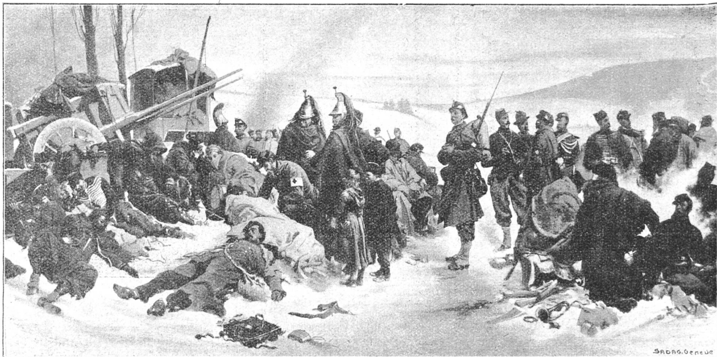
Die Bourbaki-Armee in Verrières.

Aus dem Werk Th. Curti „Geschichte der Schweiz im 19. Jahrhundert“, mit Genehmigung des Verlages Librairie-Edition S. A. Bern.