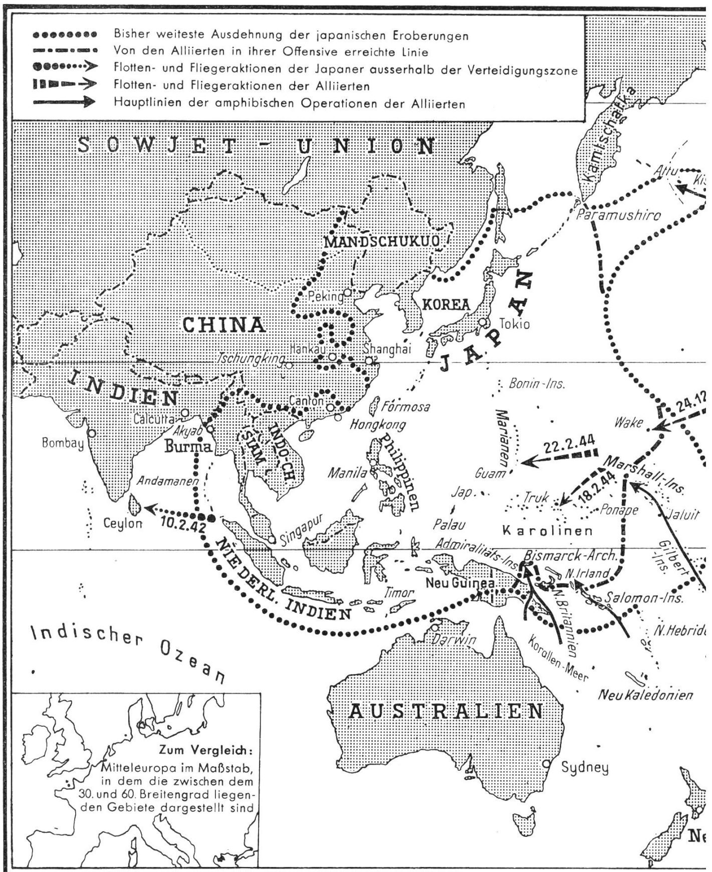
Den Bildstock für dieses Kärtchen verdanken wir der NZZ. Zeichner: Kartograph K. Vollenweider, Zürich