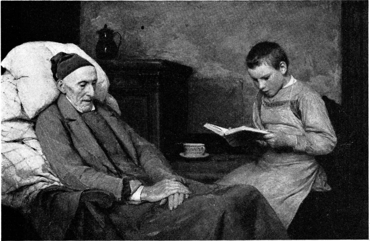
Die Andacht des Grossvaters.

heilig. Er studierte folgsam Theologie. Einmal schrieb er seufzend: «Das Gebiet der Kunst kommt mir vor wie ein verlorenes Paradies.» Freunde rieten ihm, später als Pfarrer so nebenbei zu malen. Halb Pfarrer, halb Maler also? Nein, für Albert Anker gab es nur ein «Entweder-oder». Wenn schon Pfarrer nach dem Willen des Vaters, dann ein ganzer Pfarrer. Und fleissig studierte er weiter.