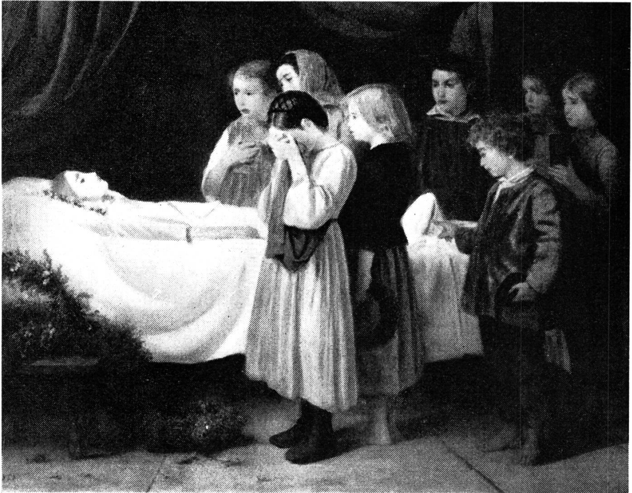
Die kleine Freundin

Ins. Es ging ihm geschäftlich nicht mehr so gut. Seine Bilder galten nicht mehr viel. Sie waren halt nicht mehr modern. Heute werden sie wieder geschätzt. Denn was gut ist, ist von bleibendem Wert, ob modern oder nicht modern.