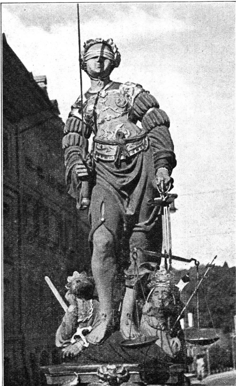
Gerechtigkeitsbrunnen in Bern.