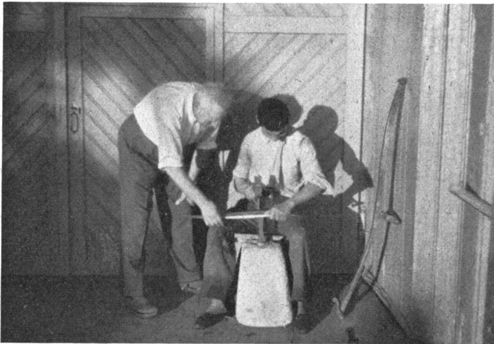
Einem Landwirtschaftslehrling wird das Dengeln erklärt

Uetendorf zählte im Berichtsjahr 39 Insassen, darunter 5 Lehrlinge in der Korbmacherei und in der Landwirtschaft. Die ehemaligen Praktikanten (Lehrlinge) wurden in Stellen plaziert und verdienen trotz sprach-