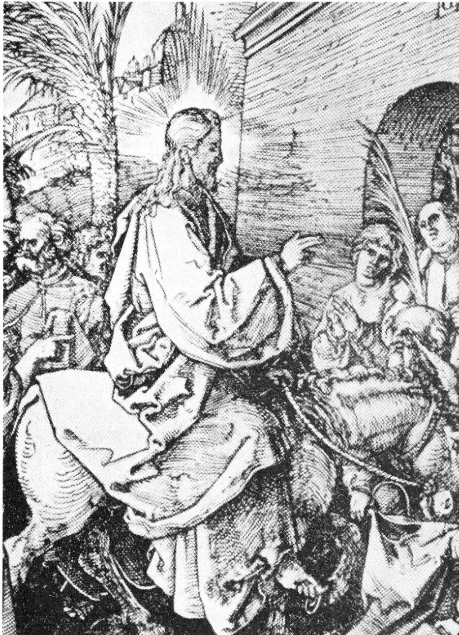
Einzug Jesu in Jerusalem von A. Dürer

Offizielles Organ des Schweiz. Gehörlosenbundes (S G B)