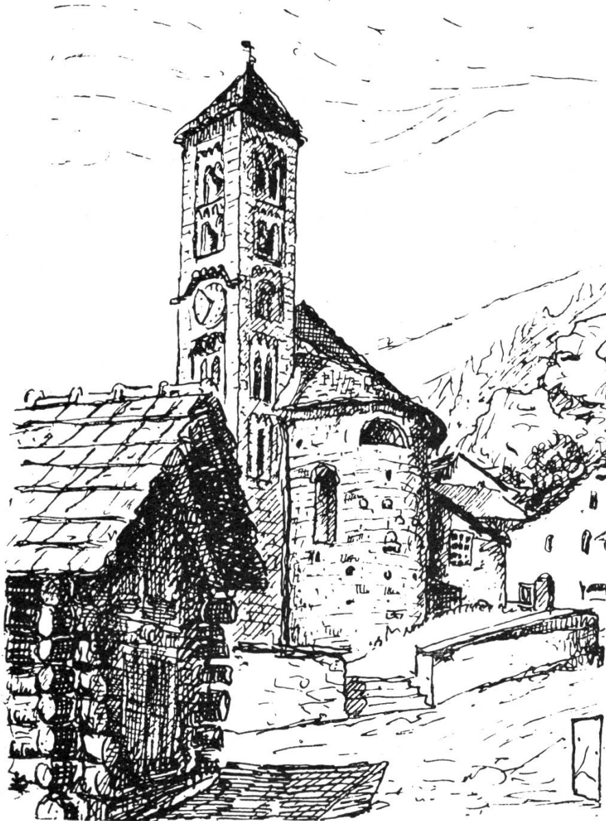
Kirche in Quinto (Tessin) Federzeichnung von Carlo Cocchi

Schweizerische Gehörlosentage in Lugano 13.-15. August 1955