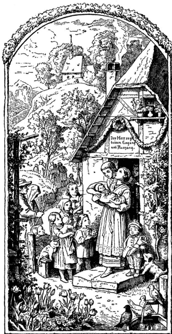
Zeichnung Ludwig Richter.

Pfingsten vor 100 Jahren. Natur- und Gottverbundenheit, Glockenklänge, Predigtgänger. Junge Mutter mit dem Täufling auf den Armen bittet emporschauend um den Pfingstsegen für ihr geliebtes Kind. Links die Taufpaten. Kinder feiern den Täufling bei seinem ersten Ausgang mit Blumensträußchen.