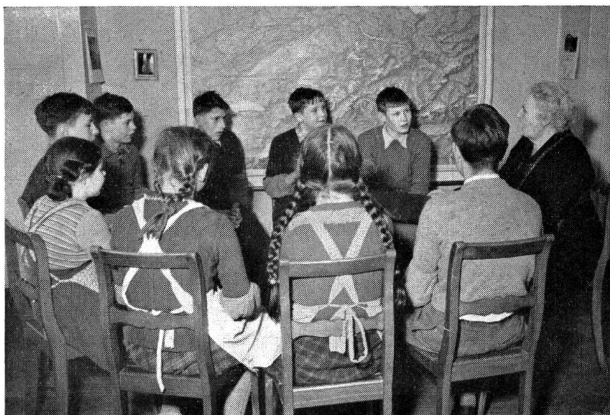
Gespräch am «Runden Tisch»

Uns allen, Kindern und Erwachsenen, wird es sehr merkwürdig und fremd vorkom-