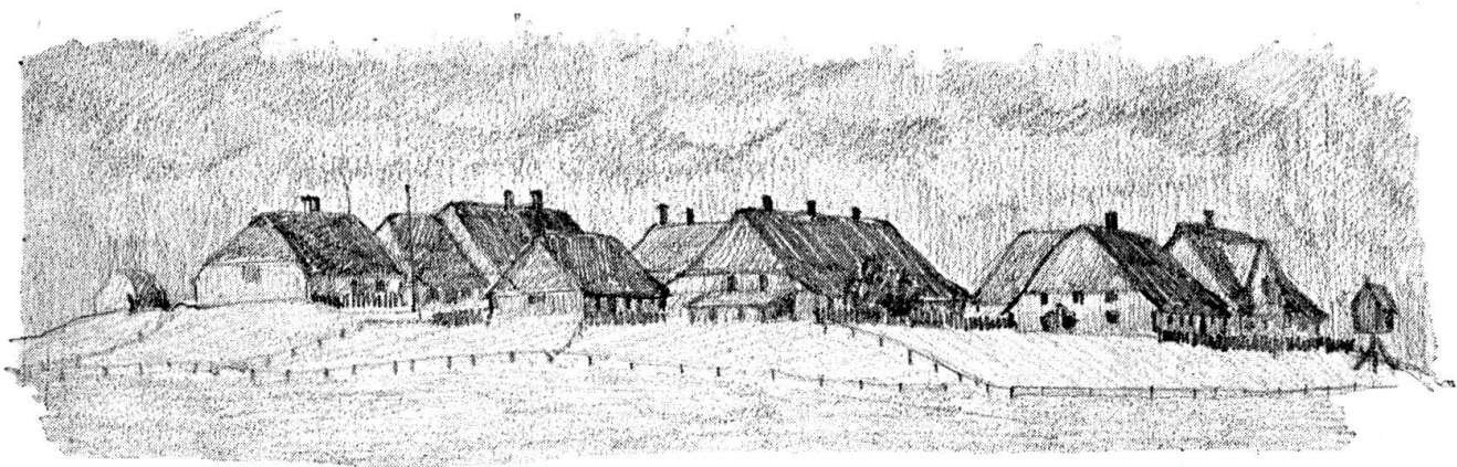
Hallig Hooge, Hauswarft

Wovon leben die Halligbewohner? Vom Fischen und von der Rinderzucht. Die Männer fahren bei Flut durch die Priele ins weite Meer hinaus. Nie fahren sie allein, es sind immer mehrere Fischerboote zusammen. Sie fischen tagelang und kommen erst nach mehreren Wochen zurück. Sie bringen nur wenige Fische heim, dafür Geld oder besser noch Lebensmittel, Tabak, Stoffe. Die Frauen und Kinder bleiben auf der Hallig zurück. Sie besorgen das Vieh. Die Kühe und Schafe fressen das grobe Halliggras. Niemand hütet die Tiere, die Priele trennen sie von der Nachbarweide.