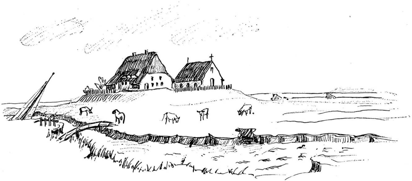
Kirchwarft Hallig Hooge