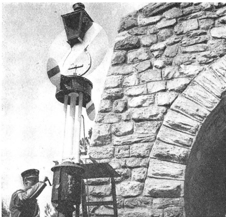
Die alten Signale müssen täglich von Hand aufgezogen werden.

dann lasse ich die betreffende Strecke sofort als gefährdet bezeichnen. Sie darf dann nur noch langsam befahren werden, bis die schadhafte Schiene ausgewechselt ist.»