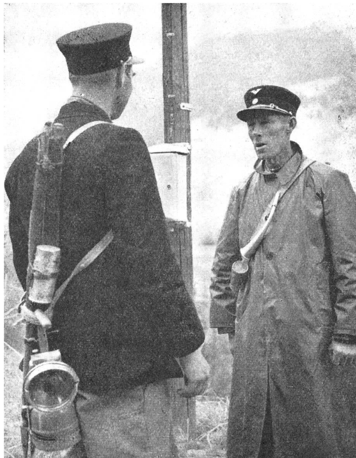
Die Ablösung der Streckenwärter erfolgt mit fast militärischer Präzision.