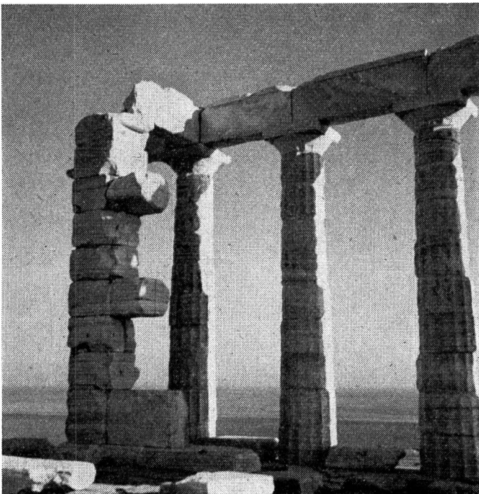
Was vom Tempel des Poseidon auf Kap Sunion übriggeblieben ist.

Am Fuße der Akropolis liegen die alten Quartiere Athens. Wir durchwandern die engen, holprigen Gäßlein und betrachten die Buden mit schönen und noch viel mehr weniger schönen Antiquitäten. Da, klatsch! Fräulein Meier liegt auf der Straße. Sie ist in einem Loch hängen geblieben. Glückli-