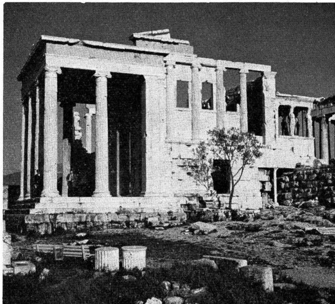
Ruine des Tempels Erechtheion auf der Akropolis, davor der heilige Olivenbaum.

Die «Käfererei» hat die Wartezeit angenehm verkürzt. Wir sitzen wieder im Mini-Flugzeug und fliegen nach Athen. Es ist dunkle Nacht, die Augen fallen zu. Erst in Athen gibt es Leben im Flugzeug. Dort setzt uns die Dan-Air um 1 Uhr früh vor