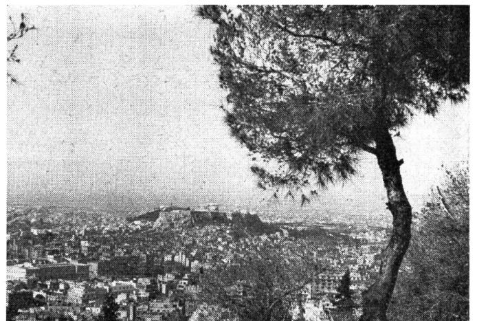
Blick auf die Millionenstadt Athen. In der Bildmitte sehen wir den Felsenhügel der Akropolis mit den Tempelbauten.

Eine Stunde Aufenthalt! Die Dan-Air trinkt Benzin und wird gebürstet und gefegt. Dann steigen wir ein. Brindisi ist unser nächstes Reiseziel. Der Süden ist heute grau und bewölkt, es dämmert schon um 6 Uhr. Wir haben nur selten Durchblicke durch die Wolken. Erst an der italienischen