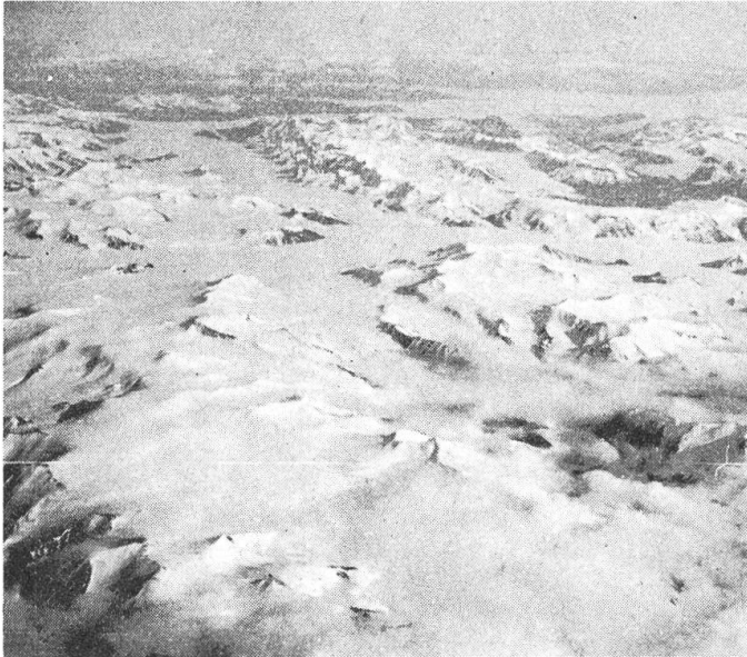
Acht Stunden lang dauerte der Flug über Eis und Schnee, über wilde, weiße Landschaften Nord-Grönlands hinweg.

diesem Wege heimzufliegen. Da hatte in letzter Stunde die niederländische KLM mit uns Erbarmen und reservierte uns zwei Plätze. Direkt aus Tokio kam die große Maschine, besetzt mit einer munteren Schar japanischer Studentinnen und Stu-