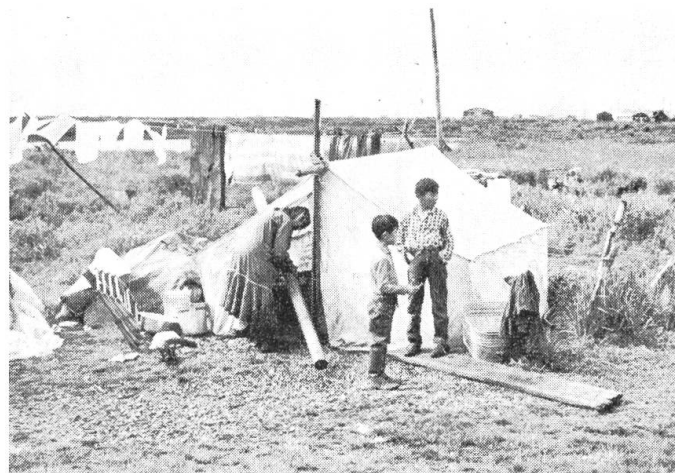
Familienzelt der Eskimos. Es ist Waschtage gewesen. Lustig flattert die Wäsche im Winde.

gelbschwarze Zug durchs Land. Auf halber Strecke unterbrechen wir die Fahrt für vier Tage. Schon seit vielen Stunden haben wir vom Wagenfenster aus den blendend weißen Gebirgsstock des Mount Mac Kin-