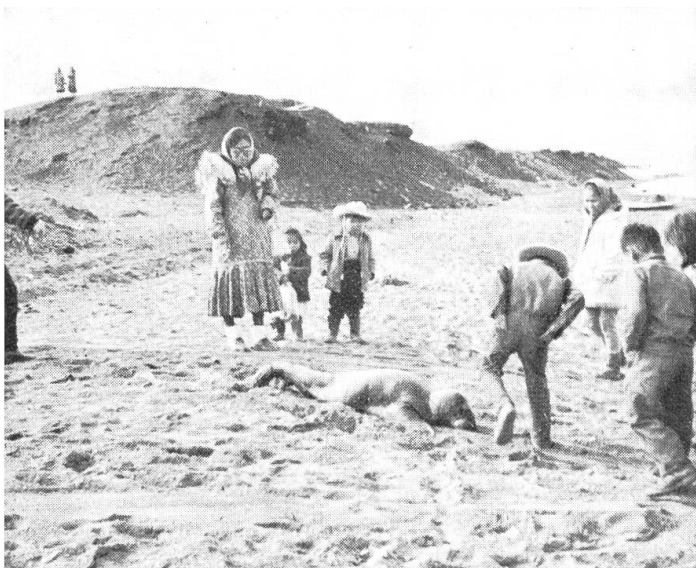
Eskimo-Knaben haben einen jungen Seehund erlegt und freuen sich an der Beute.

sie einen harten Kampf um ihr Dasein. Ihre einfache Lebensweise aus früher Steinzeit begegnet unmittelbar der neusten Zeit mit Fernsehen, Flugzeug und Super-