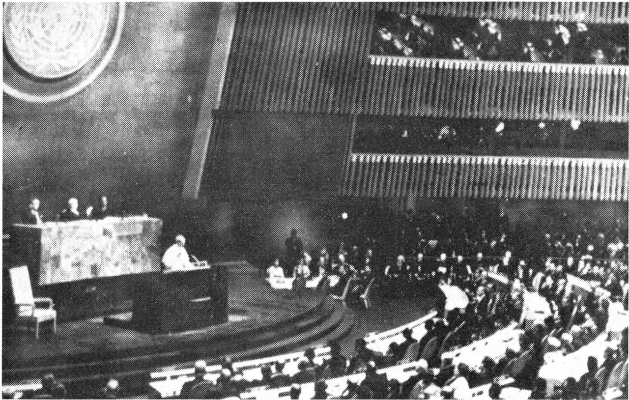
Das Bild zeigt Papst Paul VI. während seiner Ansprache in der UNO-Generalversammlung in New York.

denschluß. Aber das Morden hat jetzt wenigstens aufgehört. Vielleicht gab es auch nur darum so schnell einen Waffenstillstand, weil die modernen Waffen der beiden Kriegsparteien zum größten Teil zerstört worden sind und ihnen kein Land neue liefern will, auch die Sowjetunion nicht.