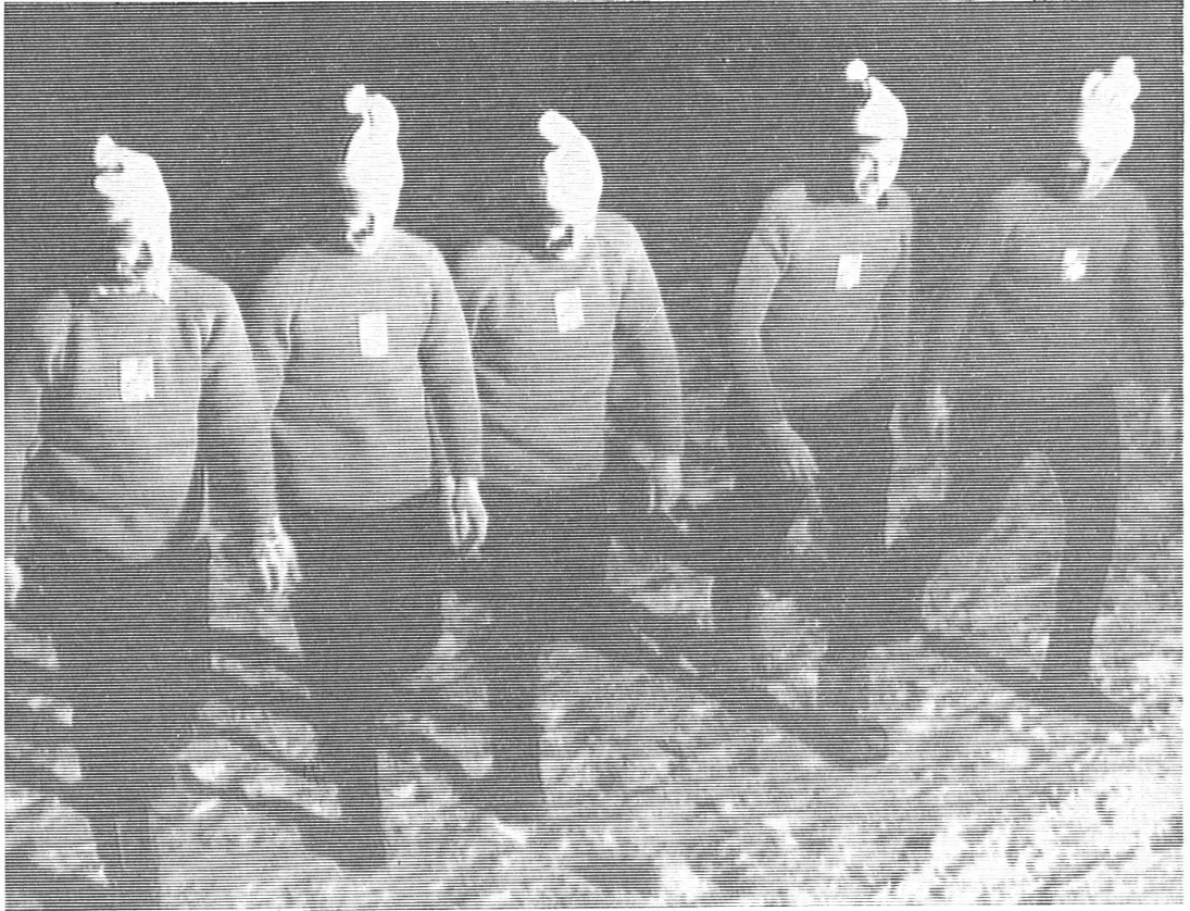
Flotter Aufmarsch der Schweizer in rotem Pullover und neckischer Kopfbedeckung

verzerrt. Unter den hörenden Anwesenden mußte es schon ganz gute Patrioten haben, wenn sie aus dem Gequietsche ihre Hymne enträtseln konnten. Im Westen färbte sich der Himmel tiefrot, die Fahnen flatterten im leichten Abendwinde, der Schnee knirschte unter den Schuhen, und der letzte Redner hatte gesprochen. Die 1. Alpenländer-Skimeisterschaften der Gehörlosen waren eröffnet.