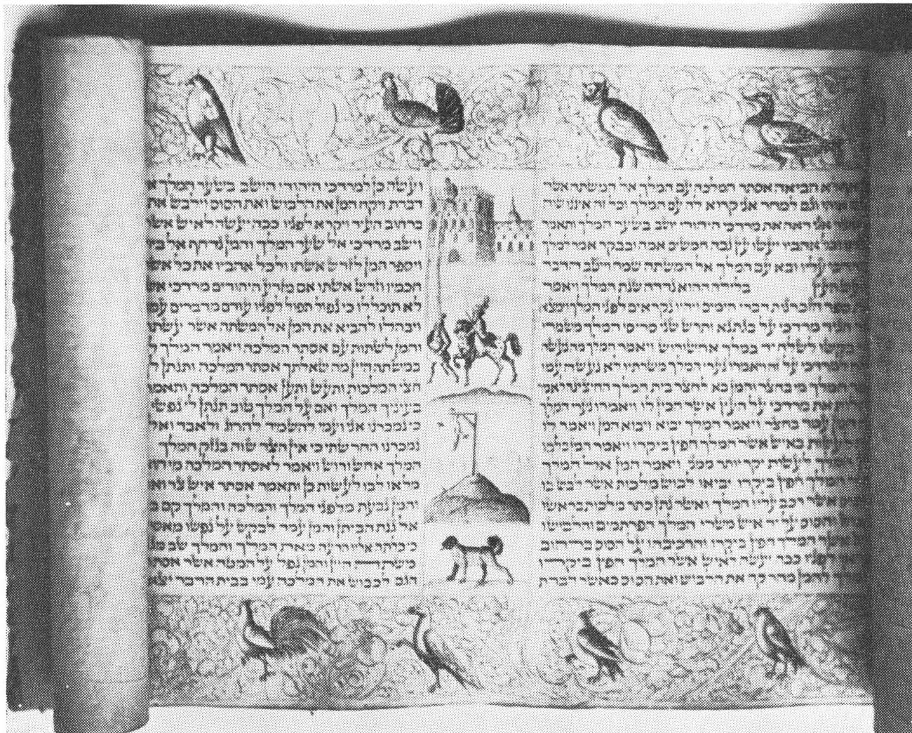
In der Schweizerischen Landesbibliothek in Bern befindet sich die größte Bibelsammlung Europas. Sie enthält rund 3000 Bände in 450 Sprachen. Unser Bild zeigt eine Schriftrolle aus dem Buche

Jede Zeit hat ihre Bücher und jedes Buch hat seine Zeit. Ist die vorüber, so ist das Buch veraltet und bald vergessen. Neue Bücher treten an ihre Stelle, die dem Geschmack der Zeitgenossen besser entsprechen. Aber ein einziges Buch hat alle die andern überlebt. Es wird seit Jahrhunderten gelesen und ist heute in fast alle Sprachen der Welt übersetzt worden. Das ist die Bibel. Dieses seltsame Buch hatte nicht etwa lauter Freunde, sondern auch mäch-