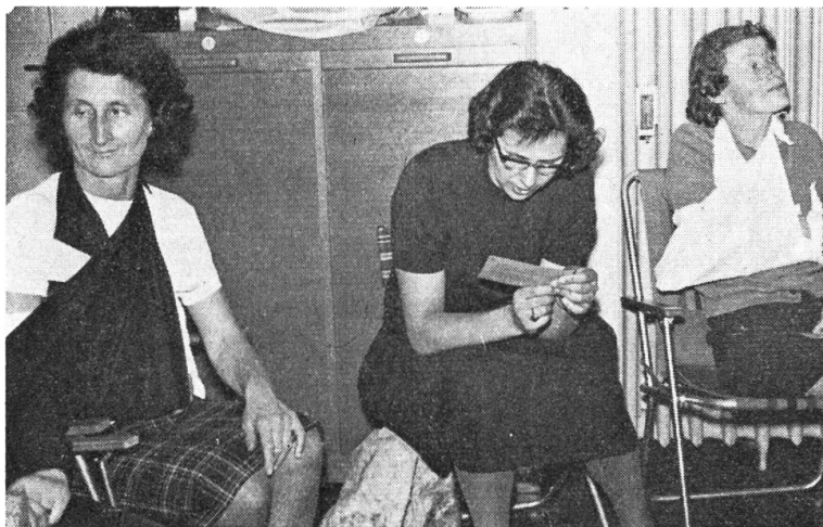
Ein Schnappschuß von der Schlußprüfung. Das Fräulein in der Mitte studiert eben die Diagnose.