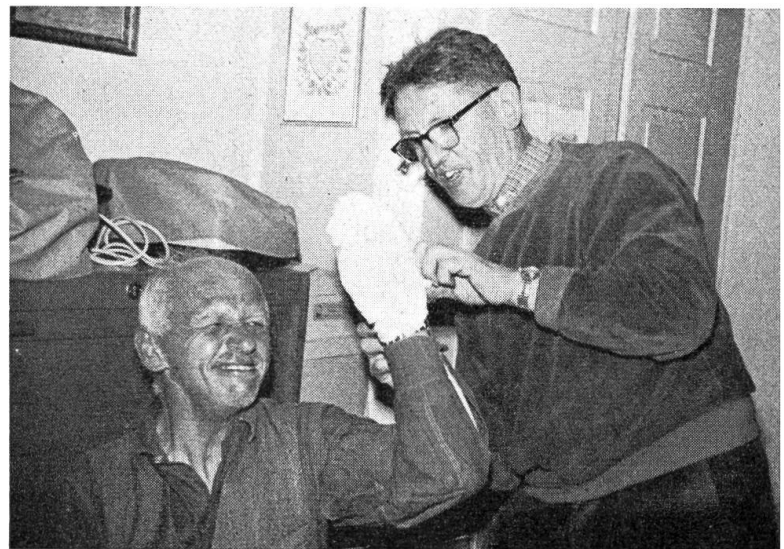
Ein fröhlicher «Verwundeter». Ob die Kursleiterin mit dem Deckverband wohl zufrieden ist?