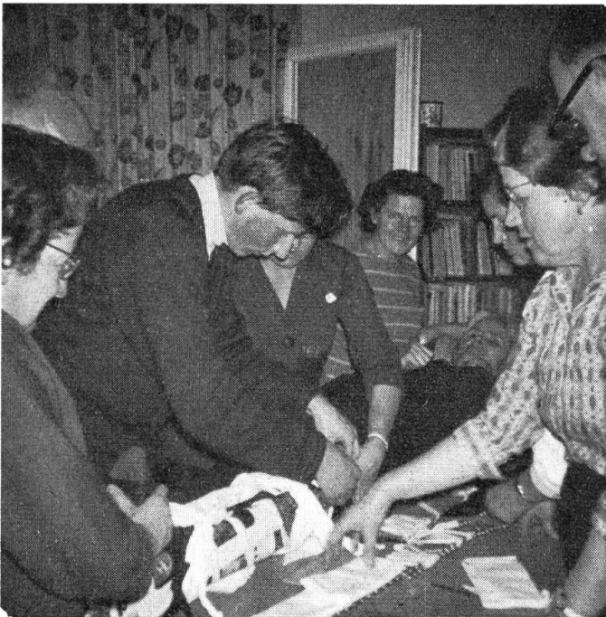
Hier wird ein gebrochenes Bein fachgemäß gesichert.

In der nächsten Zeit gibt es für uns eine erste Feldübung. Wir müssen mit Taschenlampen, gutem Schuhwerk und Regenschutz ausrücken. Da wird es sich zeigen, ob wir für die erste Hilfeleistung tauglich sind. Solche Übungen können für jeden Teilnehmer interessant und lehrreich sein. Das Alter spielt dabei keine Rolle. A. Sch.