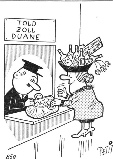
Nichts zu verzollen!