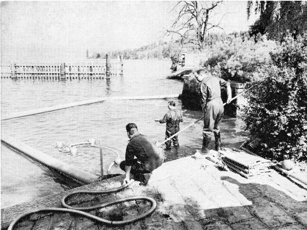
Zürcher Ölwehr bei Meilen an der Arbeit! Eine größere Menge Öl ist in einen Bach geflossen und dieser hat es in den Zürichsee getragen. Drei Männer (Kantonspolizisten) von der Ölwehr haben das von dem Öl verschmutzte Seestück bei der Einmündung des Baches sofort mit Nylonschläuchen eingedämmt. Nun sind sie eben daran, das an der Oberfläche schwimmende Öl mit einer Vakuumpumpe abzusaugen.

gewerbliche und industrielle Betriebe scheiden täglich Altöl aus, von dem nicht alles durch Verbrennen vernichtet wird. Motor- und Benzinboote verunreinigen unsere Gewässer durch Ölreste.