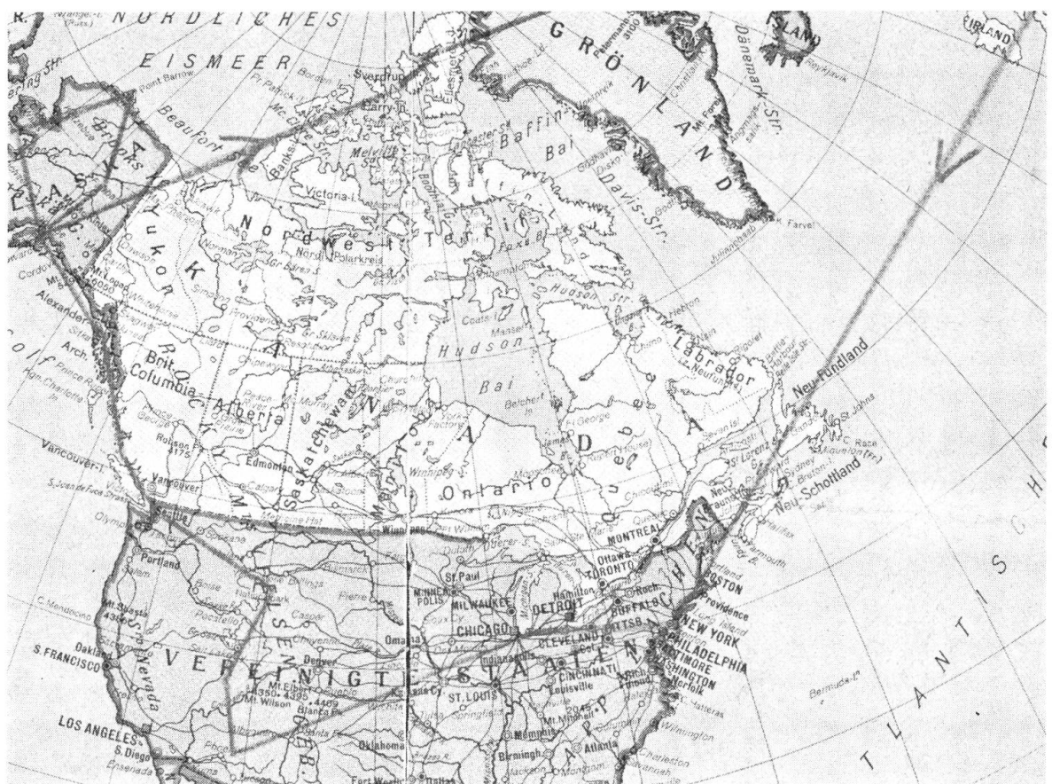
→ Unsere Reiseroute