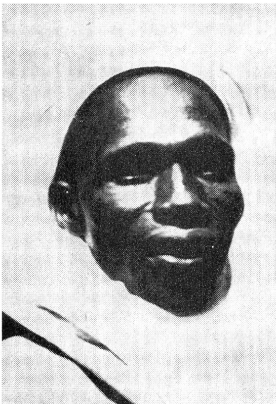
Das war der Ministerpräsident von Nigeria. Er wurde von seinen Feinden ermordet.

Der Konflikt in Rhodesien in Südostafrika (siehe «GZ» Nr. 23, 1965, und Nr. 1, 1966) ist noch nicht gelöst. Trotzdem bisher keine Waffengewalt angewendet worden ist, leidet das ganze Land doch große Not. Eine schreckliche Dürre brachte für Menschen und Vieh Nahrungsmittelmangel. Hungersnot droht. Die Wirtschaft Rhodesiens spürt immer stärker die Folgen der Ausfuhrsperre von lebenswichtigen Rohstoffen durch England und viele andere Staaten. Der hartköpfige Ministerpräsident Smith und seine weißen Freunde haben nichts mehr zu lachen. Wird die Vernunft wieder in ihre Köpfe zurückkehren?