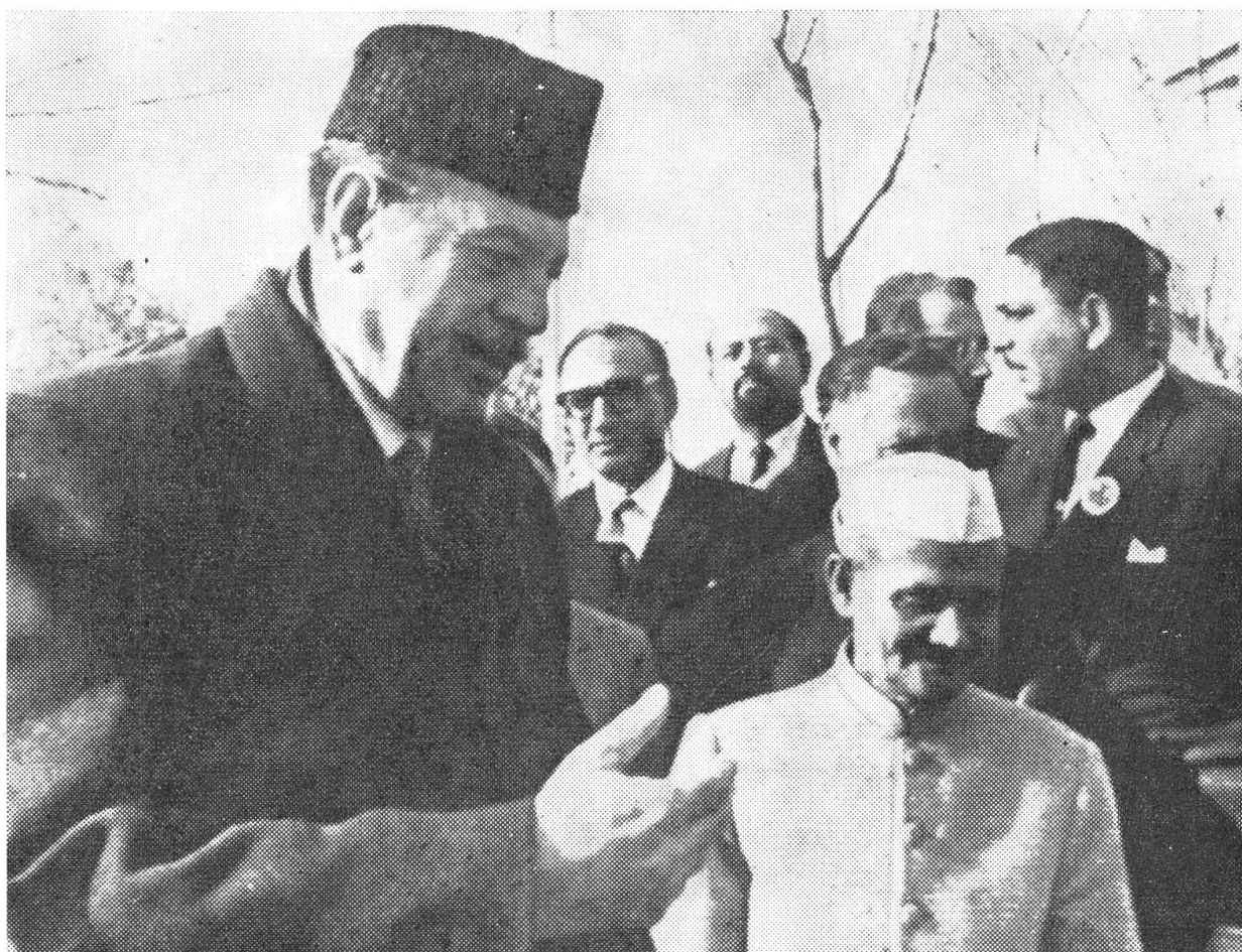
Ayub Khan (links) und Shastri (rechts) gehen nach Abschluß der Konferenz miteinander zum gemeinsamen Mittagessen. Der körperlich riesenhafte und der zwerghaft kleine Mann lächelten befriedigt über den Ausgang der Verhandlungen.

Da lud der russische Ministerpräsident den