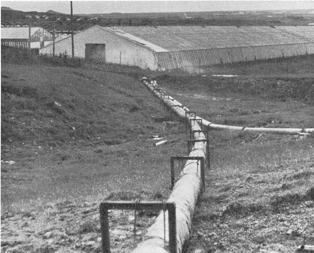
In dick isolierten (geschützten) Leitungen wird das heiße Quellwasser in die großen Treibhäuser geleitet.

bezahlen. So helfen geschickt ausgenutzte Naturkräfte das Leben in einem rauen und unfruchtbaren Lande erleichtern und verschönern. Aber eben, Rosen am Polarkreis kann man nicht in Gärten bewundern, sondern nur in Treibhäusern.