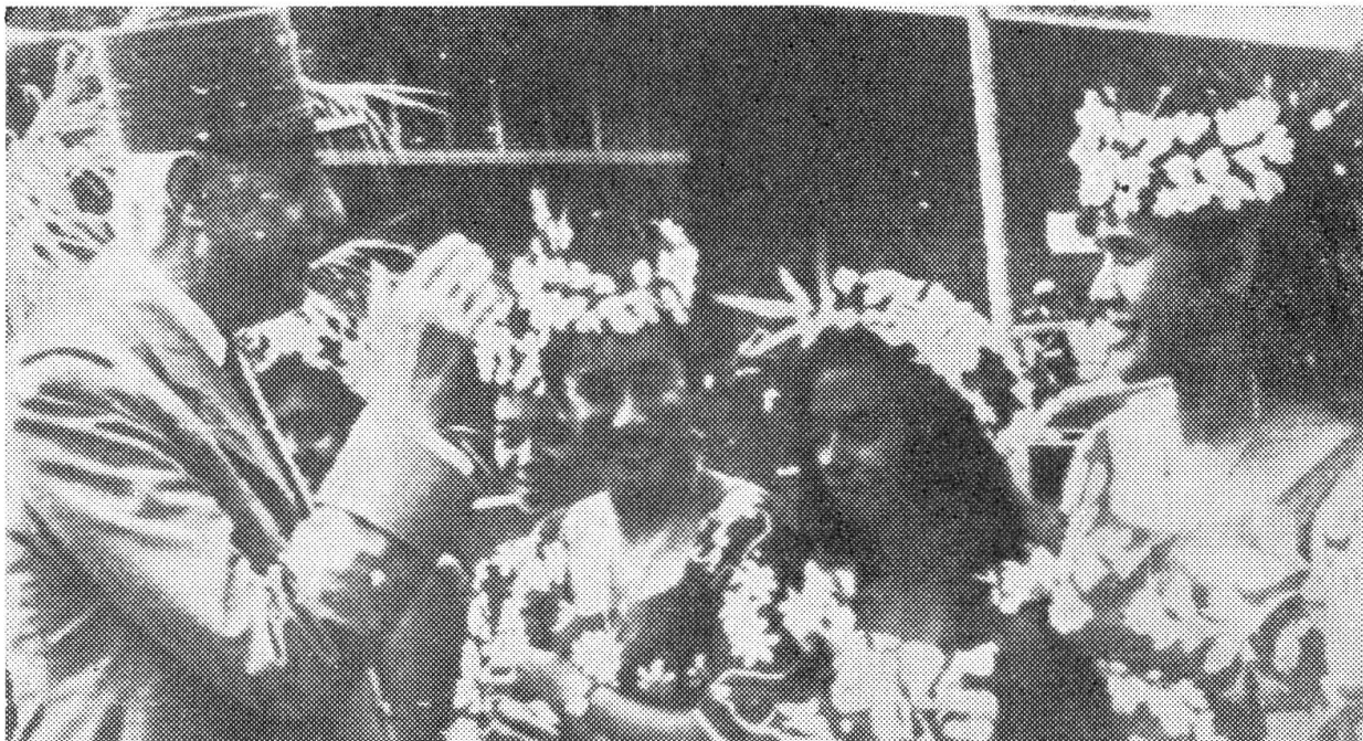
De Gaulle in Tahiti: Blumenmädchen — und Atombombenexplosion