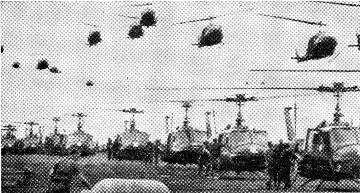
Hunderte amerikanischer Helikopter stehen in Vietnam täglich im Einsatz

Schönheit bewundern. Er wollte bei der Explosion einer französischen Atombombe dabeisein, die man über einer kleinen Insel südöstlich von Tahiti zum Explodieren brachte!