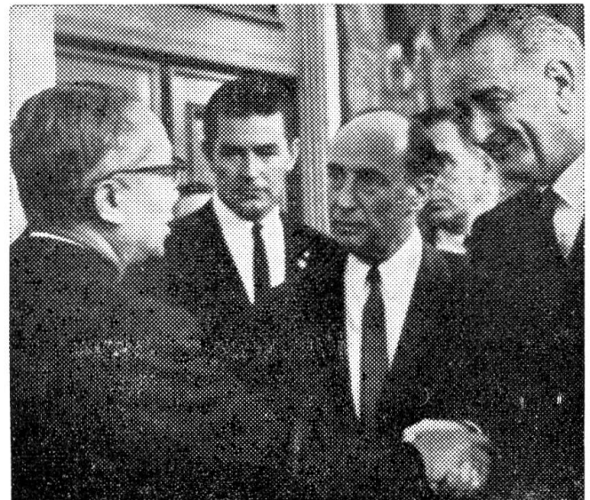
U Thant (mit Brille) im Gespräch mit Präsident Johnson (ganz rechts)

aller Welt gesprochen und sie um Unterstützung seiner Gedanken und Pläne für den Weltfrieden gebeten. Jetzt hat er genug und will zurücktreten. Die General-