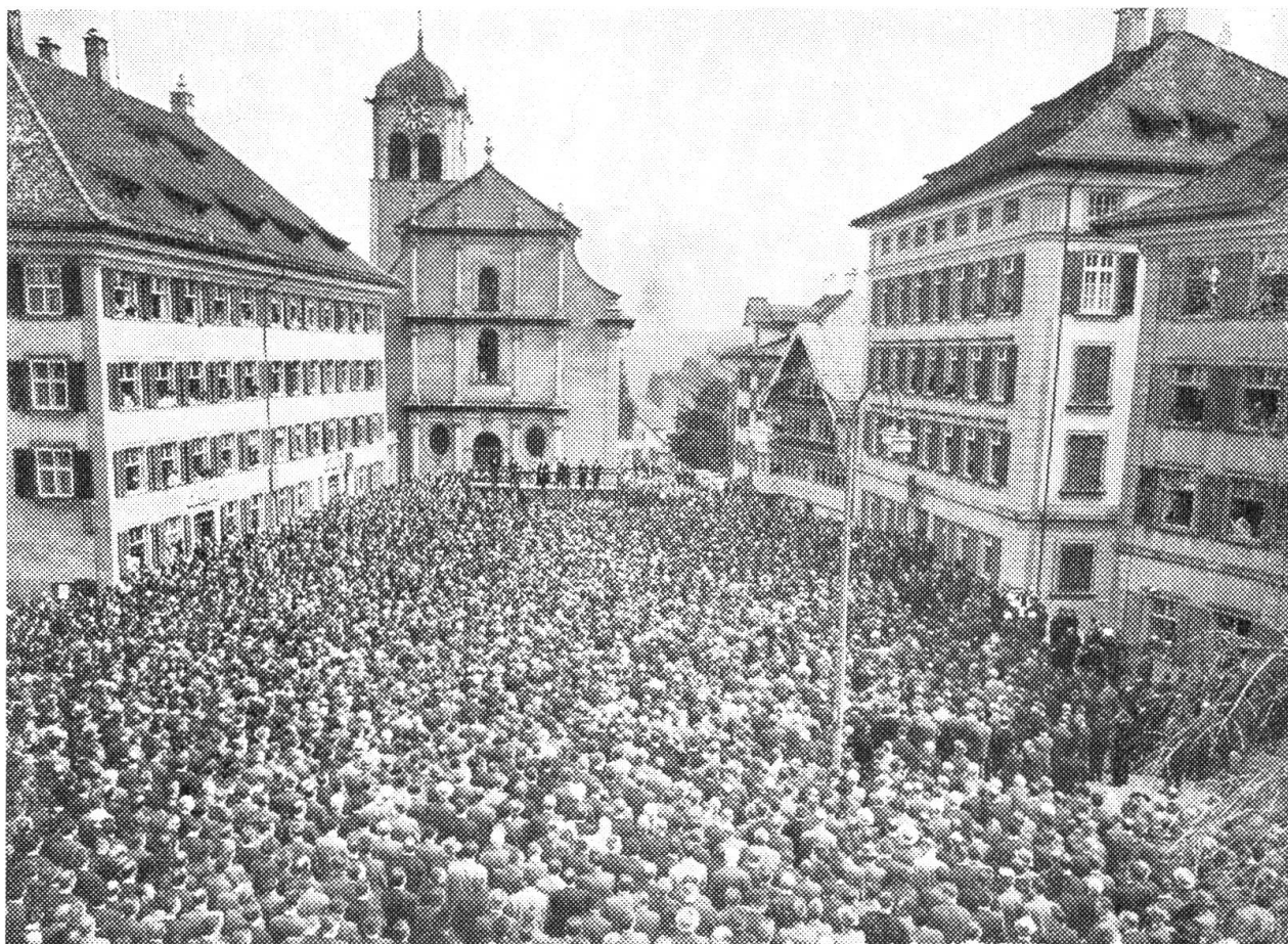
Die Landsgemeinde von Appenzell-Außerrhoden

Bei frühlinghaftem Wetter versammelten sich am Sonntag gegen 9000 degenbewehrte Männer aus den 20 Gemeinden Außerrhodens auf dem historischen Dorfplatz von Trogen zur politischen Jahrestagung. Unser Bild zeigt einen Überblick über die Landsgemeinde von Trogen.