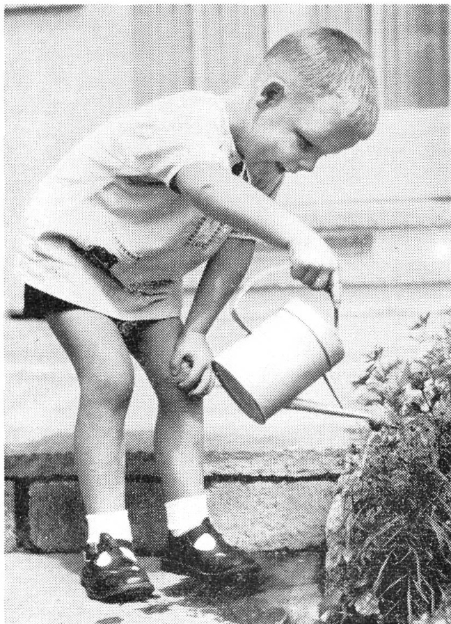
Ein zukünftiger Stimmbürger

sonders viel politisiert und diskutiert. Man sitzt zu zweit oder in Gruppen zusammen und bespricht die Abstimmungsvorlagen, Wahlprogramme der Parteien oder übt Kritik an den Behörden. Je nach Temperament kann es dabei mehr oder weniger lebhaft zugehen. Da kommen die verschiedensten Ansichten zum Ausdruck, was im Interesse der Gemeinde oder des Landes getan oder unterlassen werden sollte. Glücklicherweise kommt es bei uns nicht mehr vor, daß politische Leidenschaften in Schlägereien ausarten, so daß zur Aufrechterhaltung von Ruhe und Ordnung Polizei und Militär aufgeboden werden muß. Was ist nun Politik? Sie ist jedenfalls nichts Überflüssiges oder etwas, dem man lieber den Rücken kehren sollte. Im Gegenteil, jeder Bürger sollte sich positiv zu ihr stellen. Auseinandersetzungen über politische Fragen können zwar manchmal zu unerfreulichen Entgleisungen führen. Aber das sind nur Begleiterscheinungen, die bei jeder andern guten Sache auch vorkom-