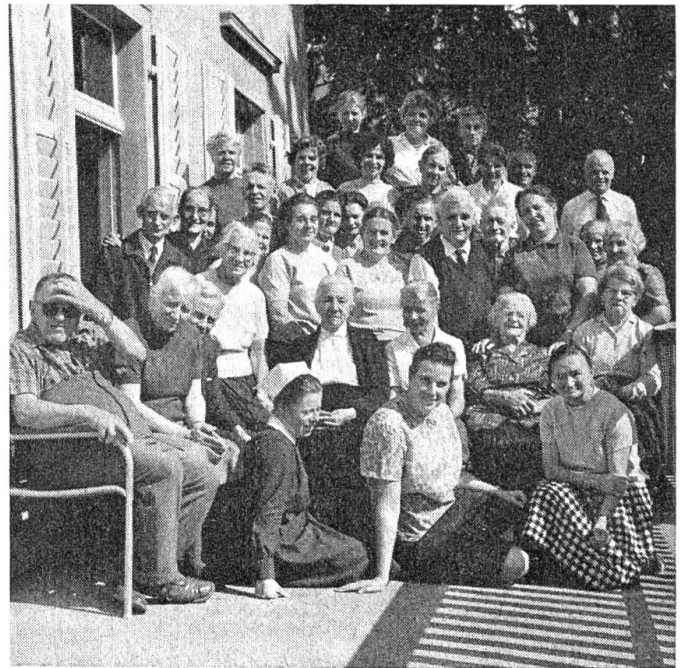
Lauter zufriedene Gesichter

Der Text auf der Wandtafel erinnert an die soeben beendete Andachtsstunde. Jedes Mittel, das bei Vorträgen das Verständnis und Verstehen erleichtern kann, ist berechtigt und für die Gehörlosen eine Wohltat.