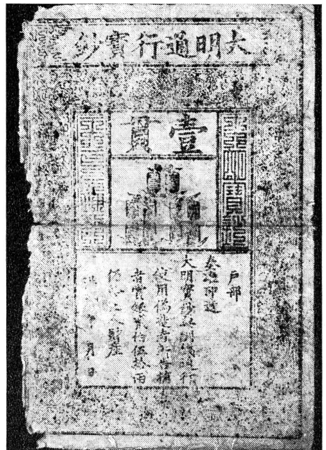
Die älteste noch erhaltene Banknote der Welt stammt aus der chinesischen Ming-Dynastie (1368 bis 1398).