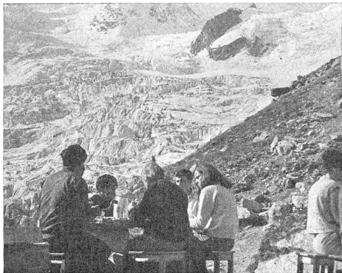
1. August 1968: Frühstück am Roseggletscher.