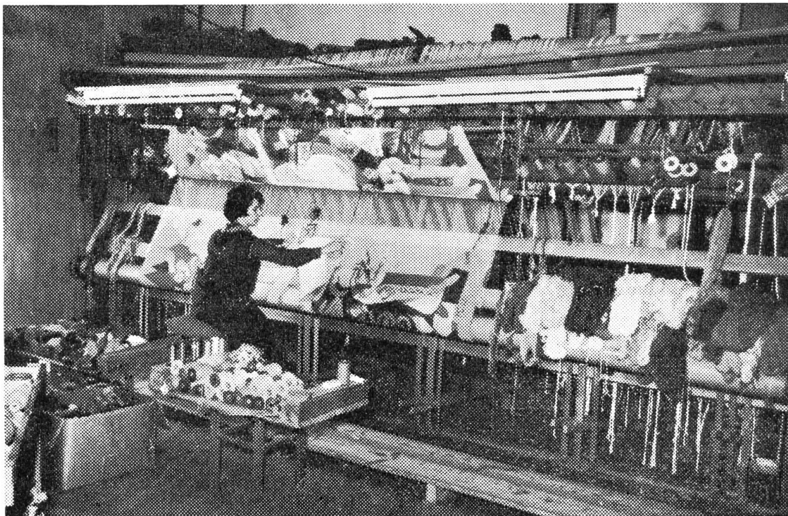
Unter den geschickten Händen der Weberin entsteht ein wundervoller Wandteppich.

In Frankreich ist dieses Kunsthandwerk nie ganz ausgestorben. In neuester Zeit ist auch in unserem Lande die Freude an Wandteppichen erwacht. Vor mehreren Jahren wurde in Schaffhausen das Innere des alten Münsters renoviert. Wenn ich mich recht erinnere, hatten sich einige Schaffhauser Frauen bereit erklärt, für die Chorwand (Vorderwand) einen grossen