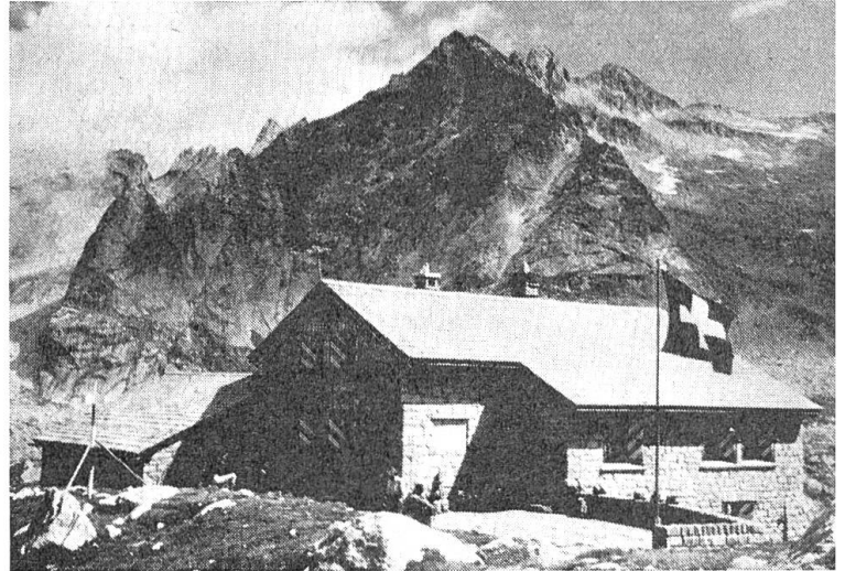
Albignahütte SAC mit dem Piz Cacciabella. Die erste Spitze links von ihm ist der Il Gall, den wir bestiegen.

Die neue, moderne Albignahütte gehört der Sektion St. Gallen. Ihre Schlafräume waren sauber.