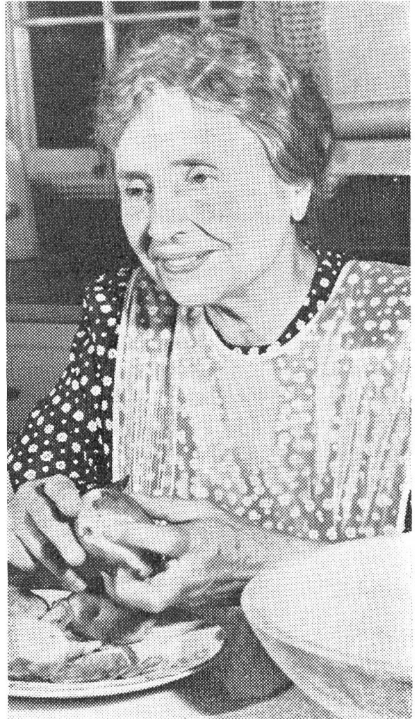
Unser Bild zeigt Helen Keller in ihrem Heim in Westport.

Helen Keller war schon fast sieben Jahre alt, als Annie Sullivan zu ihr kam. Das