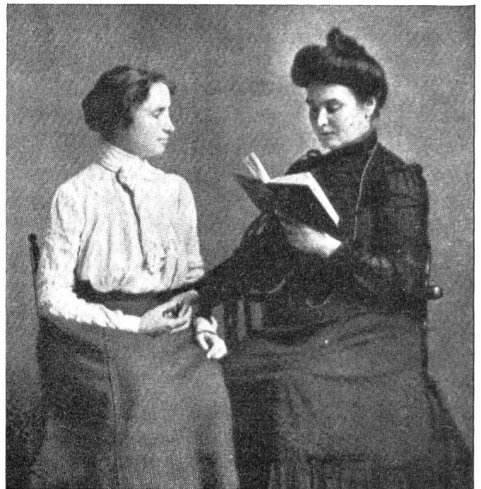
Fräulein Sullivan hilft Helen Keller beim Studium. Sie liest ihr mittels des Fingeralphabets aus dem Lehrbuch vor.

Folgendes geschah in den ersten Wochen der Lernarbeit: Annie Sullivan ging mit