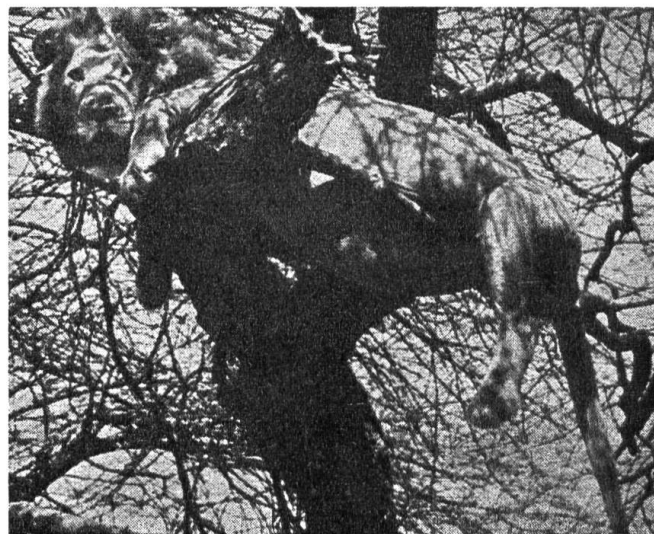
Den Bauch vollgefressen, faul und träge — und in luftiger Höhe in Sicherheit vor Plagegeistern der afrikanischen Steppe.

Noch schlimmere Plagegeister sind die 5 bis 8 Millimeter grossen Tsetsefliegen . Sie schwirren nur in geringer Höhe bis zu einem Meter über dem Erdboden umher. Sie haben keinen Respekt (keine Hochachtung) vor dem König der Tiere. Sie surren um seine Augen, seine Nüstern (Nasenlöcher) und sogar in seinen Ohrmuscheln. Dieses Surren kann ihn ganz verrückt machen.