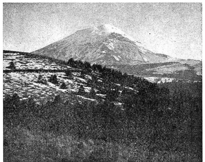
Der stolze Popocatepetl mit leuchtender Schneekappe.

Die reinen Indianer sind kleine, dunkelbraune Menschen. Sie sind Bauern und leben in kleinen Dörfern im Busch. Dort errichten sie ihre Hütten aus selbstgeformten, an der Sonne getrockneten Backsteinen. Der Hausbau ist einfach: vier Wände, darüber ein Palmblätterdach. Es gibt nur einen Raum, keine Möbel zum Abstauben, keinen Boden zum Putzen, auch keinen Abort.