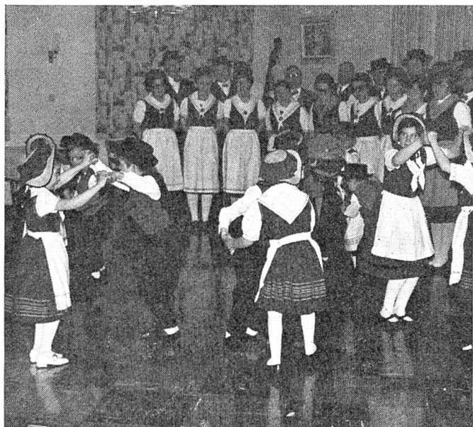
Herzerfrischender Tanz der Minitrachtenleute.