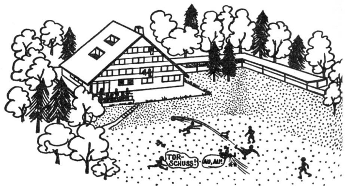
Blaukreuzheim ob Weggis (LU).

In strömendem Regen fuhren wir auf die Schiffsstation. Wir durften mit dem Extraschiff nach Luzern fahren und dem Seenachtsfest beiwohnen. Es gab ein imposantes Feuerwerk. An Bord waren die Leute