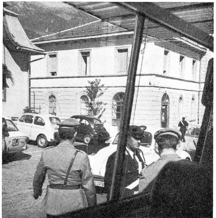
Ein vertrautes Bild für Italienfahrer: Zöllner und Grenzwächter prüfen die Ausweise, hier an der Grenzstation im Münstertal.

Dieser Vers war dann auch nachher immer unser Abendsegen.