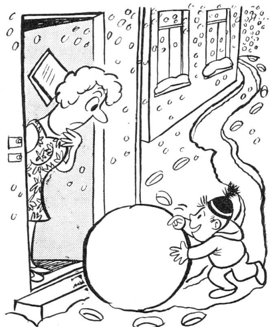
«Das Brot ist da drin!»