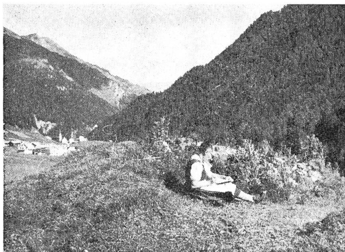
Frl. Egger hat sich ein stilles Ruheplätzchen ausgesucht. — Im Hintergrund Campatsch, das unterste Dörflein des Tales.

fruchtbare Vintschgau (italienisch: Val Venosta) war wunderbar. Es ist eines der grössten Obstbaugebiete Europas. Schon von weitem sahen wir die mit rotgoldenen Aepfeln behangenen Bäume, und nachher waren die schönen Früchte oft zum Greifen nahe. Auch den höchsten, mit ewigem