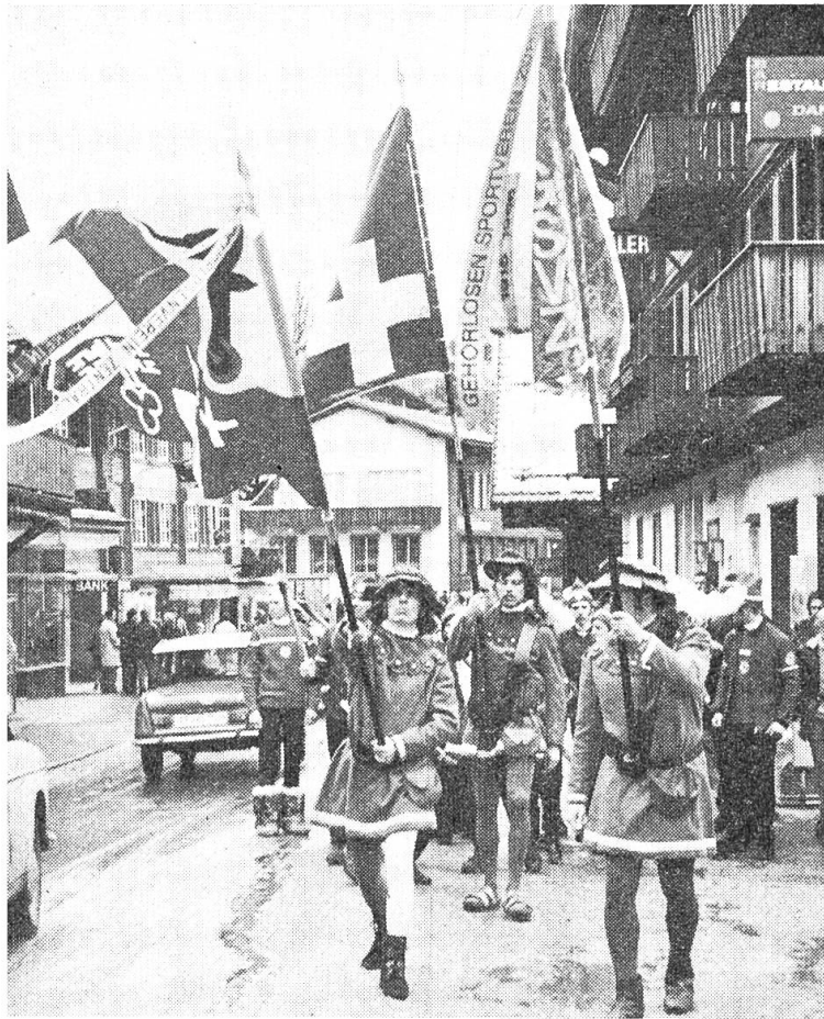
Die neueingeweihte Fahne des Schweizerischen Gehörlosen-Sportverbandes, eskortiert vom Banner des Gehörlosenvereins Zentralschweiz und vom Gehörlosen-Sportverein Zürich.

nierte, gute Gäste. Dabei war das Wetter gar nicht gut, man musste vieles umdisponieren (umstellen). Trotz Schnee, Wind und Kälte haben viele Schlachtenbummler sich auf den Wettkampfplätzen eingefunden, um ihre Wettkämpfer anzufeuern. Sie haben auch die zusätzlichen Kosten nicht gescheut. Es waren schöne und faire Kämpfe, ganz in dem Geiste der «Zehn Eigenschaften des guten Sportlers», die von drei gehörlosen Wettkämpfern in der Kirche gesprochen wurden. Es war ein schlichter, eindrucklicher Gottesdienst. Die Kirche war geschmückt mit den Fahnen der 13 Nationen. Herr Pfarrer Pfister sprach für die reformierten, Herr Pfarrer Brunner für die katholischen und Reverend Thompson für die anglikanischen Zuhörer. Die Kirche war bis auf den letzten Platz mit aufmerksamen Zuhörern besetzt. Herr Brandner, ein hörender junger Mann