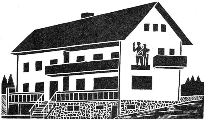
Erholungsheim der Gehörlosen in Kirchschiag

stummen-Pfarramt und die Gehörlosenfürsorge haben dort ihre Büroräume. In andern Städten der Schweiz gibt es ebenfalls Klubräume, die aber gemietet werden müssen. (Hier irrt der Verfasser. In Bern, St. Gallen und Solothurn zum Beispiel müssen die Gehörlosen für die Benützung der Klubstube keine Miete bezahlen. Red.) Vereinsversammlungen können dort aber nicht abgehalten werden, weil diese Klubstuben zu klein sind. — Die Schweizer Behörden sind also, im Gegensatz zu den österreichischen, nicht grosszügig.