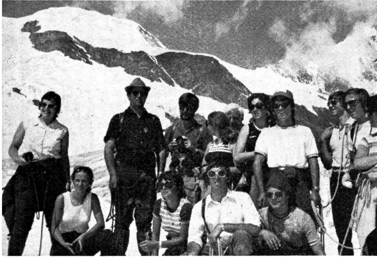
Zur Gletscherwanderung gut ausgerüstet. Unterwegs zur Britannia-Hütte.