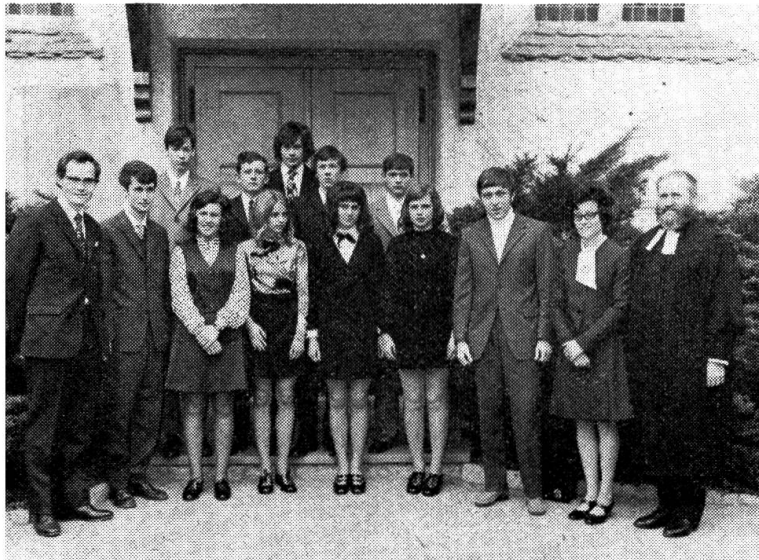
Jugend ... Konfirmation 1972 in Münchenbuchsee