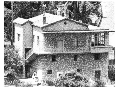
So sieht heute die Hinterfront aus.

Für alle Hilfe, die wir aus der Schweiz erhalten haben um die Renovation durchzuführen, danken wir ganz herzlich.