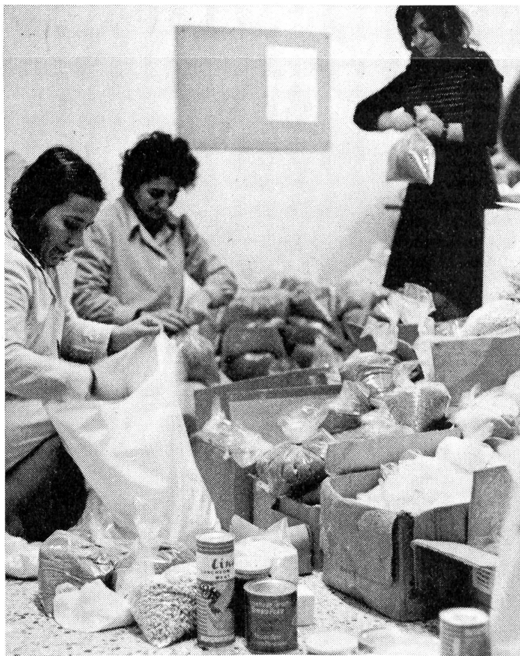
(Leihkloster Schweizer Samariter)

Es gibt aber auch materielle Probleme , die kleinwüchsige Leute stark belasten. Sie haben viel Mehrauslagen an Kleidern, Schuhen, Wohnungs- und Fahrzeugeinrichtungen. Sie sind behindert bei der Benützung öffentlicher Einrich-